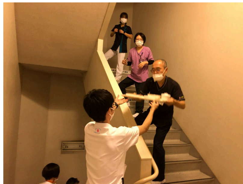
【職員による配膳リレー】